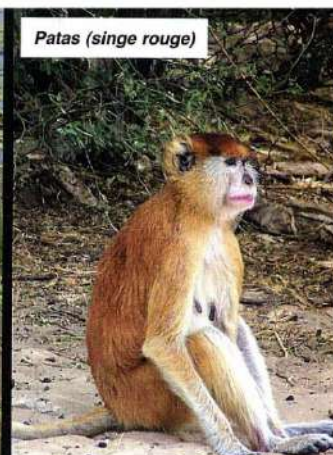
Patas (singe rouge)