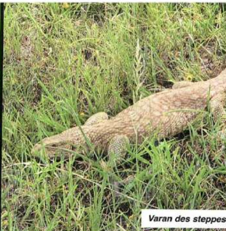
Varan des steppes